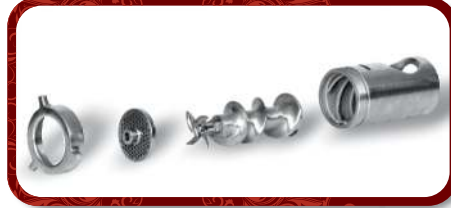
Removable Head Unit