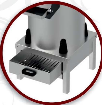
Filtre | Filter