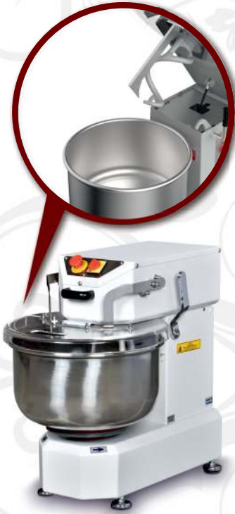
BSH.20 Kalkar Kafa